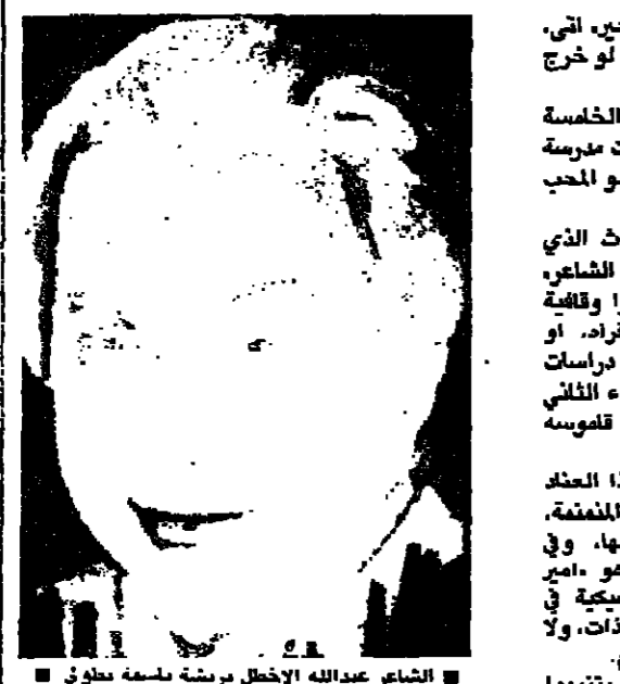
الشاعر عبدالله الاخطل مبرهنه لسلمه بطولي

ولها في قراء هذا الشاعر ان يتبوهوا لشايفين الاول - انه يستمر في اكمال مسيرته الشعر الاصولي الذي يتكر بجذالية لبنان، والثاني انه يقرا شعرا اصوليا على منبر لأول مرة.